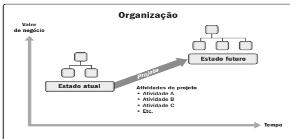
Figura 3: Transição de um estado organizacional por meio de um projeto

As Lições aprendidas são usadas para melhorar o desempenho do projeto e evitar a repetição de erros. O registro das lições aprendidas pode incluir a categoria e a descrição da situação, impacto, recomendações e ações propostas associadas com a situação, dificuldades, problemas, riscos e oportunidades percebidas (PMI, 2017).